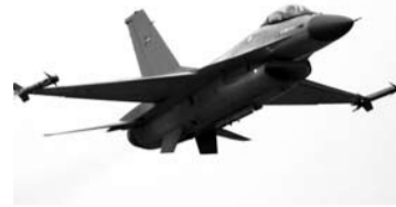
Internetė rašoma, kad naikintuvai sprogimą primenantį garsą sukelia tuomet, kai viršija garso greitį.

ir sąjungininkų karių planuoja bei vykdo oro gynybos operacijas, įskaičiuojant kovinį patuliavimą, mūšio valdymą ir kuro papildymą ore, imituoja įvairias antžemines ir oro grėsmes.