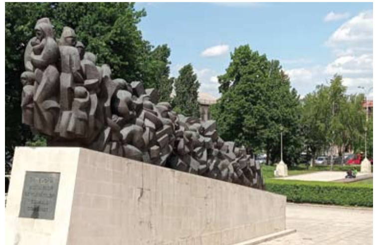
Paminklas pagerbti į Sibiro gulagus ištrėmtiems 100 tūkst. Moldovos gyventojų.

„Rumunišką pasą daug kas išsiėmė dėl baimės, kad Moldovą vėl gali okupuoti Rusija, mat su tokiais pasu tada būtų galima pabėgti į Vakarus“, - paaiškino S.Durlleshteanas. Verslininkas prisipažino, jog Maskvai vasario 24 dieną užpuolus Ukrainą jis svarbiausius daiktus susidėjo į lagaminą ir jame juos laiko