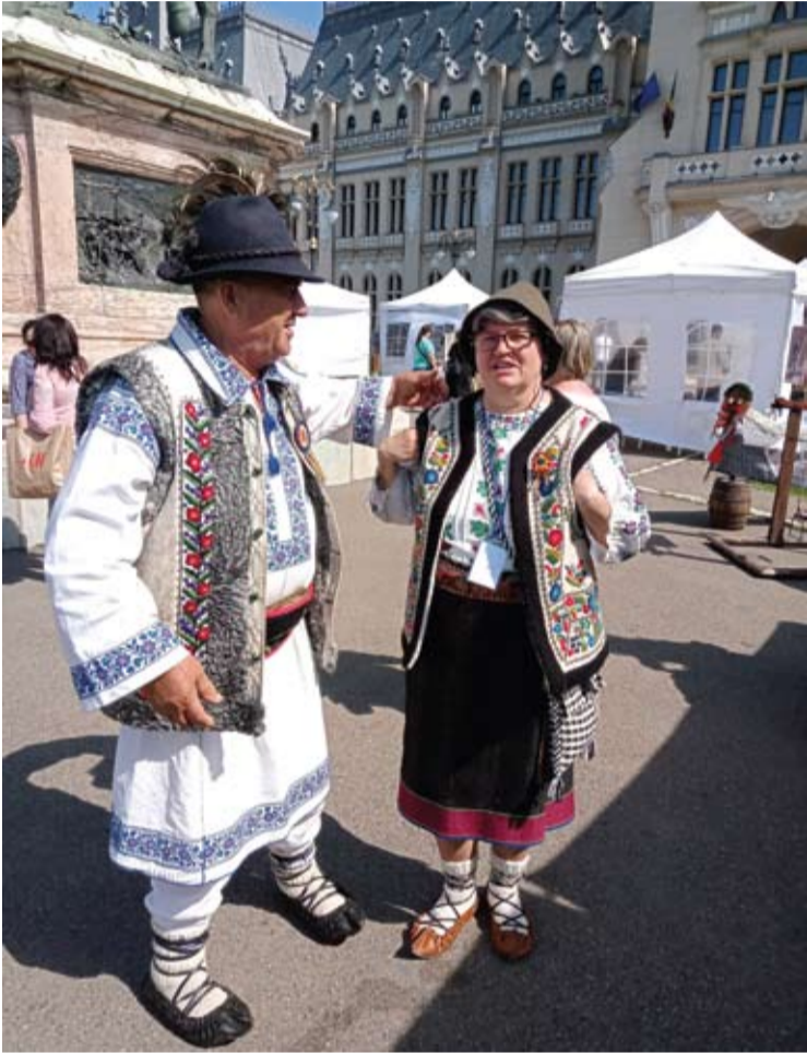
Žmonės čia mėgsta dėvėti nacionalinius drabužius.

Nuogaštavimai, kad gegužės devintą dieną Maskva pradės maštabišką Odesos puolimą, nepasitvirtino, tačiau to čia visgi labai bijoma.