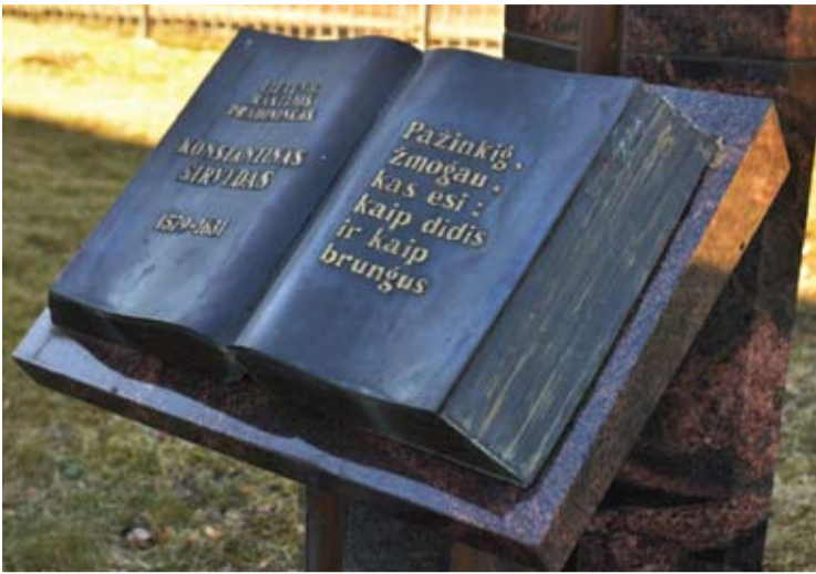
Atkurtas 1988 – aisiais K. Sirvydo gimtinėje pastatytas, vėliau suniokotas paminklas dabar stovi Dabužių bažnyčios šventoriuje.